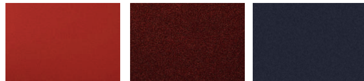
Naranja Rojo Azul